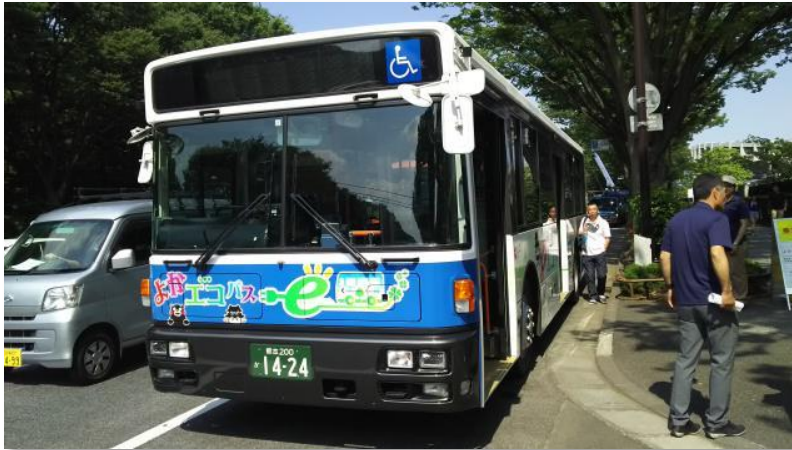
外観・内装ともに普通の路線バスです