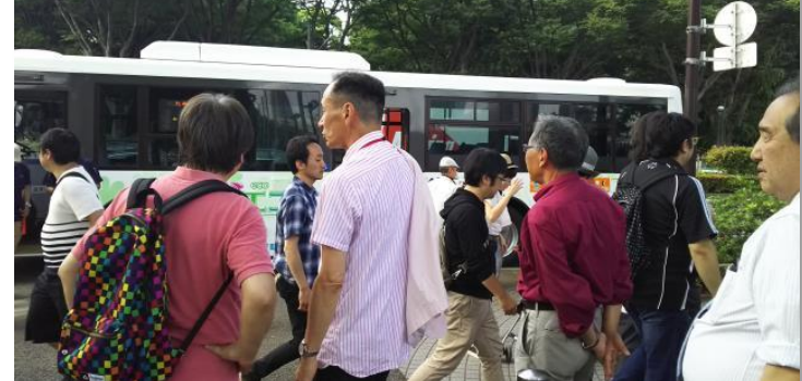
松田さんはお客様への対応に大忙しでした